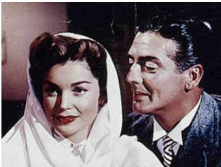
1952 LA PREMIÈRE SIRÈNE (Million Dollar Mermaid) de Mervyn LeRoy avec Victor Mature