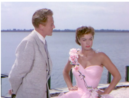
1953 DÉSIR D'AMOUR (Easy to love) de Charles Walters avec Van Johnson