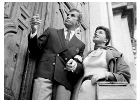
1961 LA FONTAINE MAGIQUE (La Fuente magica) de Fernando Lamas avec F. Lamas