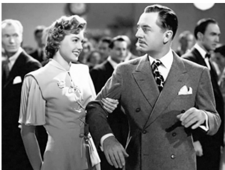
1945 THE HOODLUM SAINT de Norman Taurog avec William Powell