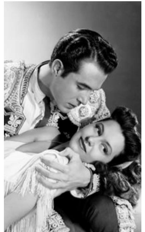
1947 SENORITA TORÉADOR (Fiesta) de Richard Thorpe avec Ricardo Montalban