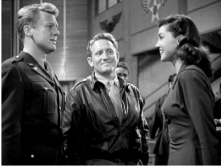
1943 UN NOMMÉ JOE (A Guy named Joe) de Victor Fleming avec Van Johnson, Spencer Tracy