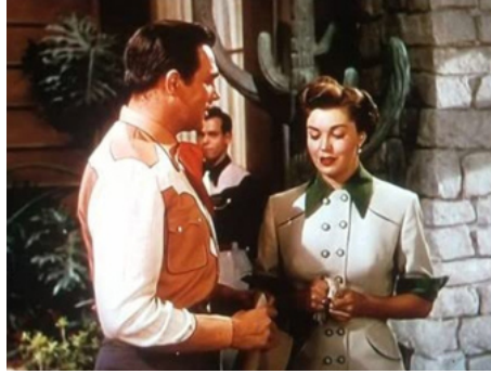
1951 CARNAVAL AU TEXAS (Texas Carnival) de Charles Walters avec Howard Keel