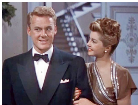
1946 ÈVE ÉTERNELLE (Easy to wed) d'Edward Buzzell avec Van Johnson