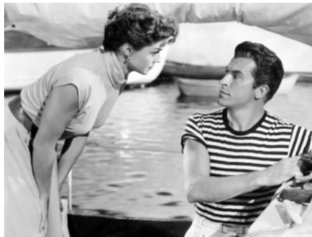
1953 TRAVERSONS LA MANCHE (Dangerous when wet) de Charles Walters avec Fernando Lamas