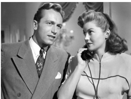
1947 LE SOUVENIR DE VOS LÈVRES (This time for keeps) de Richard Thorpe avec Johnny Johnson