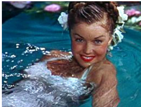
1945 ZIEGFELD FOLLIES (Ziegfeld Follies) A Water Ballet de George Sidney et Merrill Pye