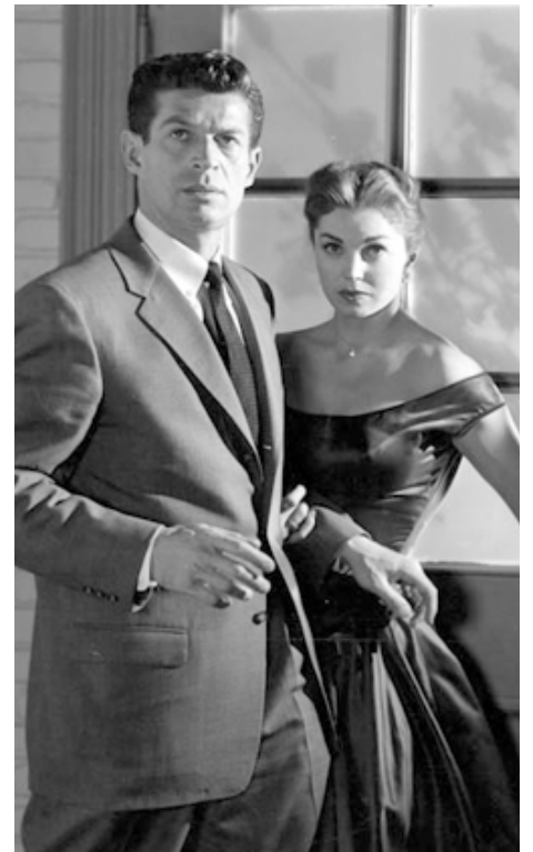
1956 L'ENQUÊTE DE L'INSPECTEUR GRAHAM (The unguarded Moment) d'H. Keller avec George Nader