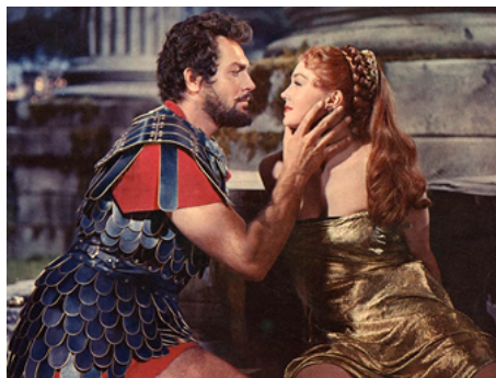
1954 LA CHÉRIE DE JUPITER (Jupiter's Darling) de George Sidney avec Howard Keel