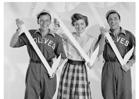
1949 MATCH D'AMOUR (Take me out to the ball game) de Busby Berkeley avec Frank Sinatra, Gene Kelly