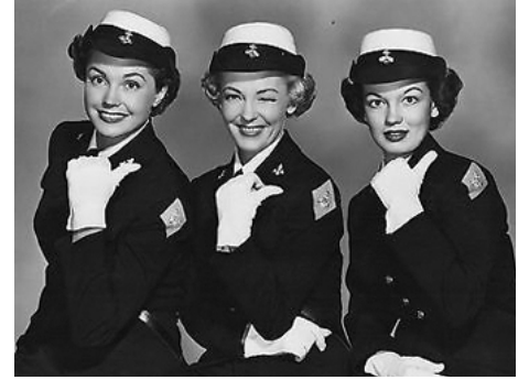
1952 JUPONS À L'HORIZON (Skirts ahoy !) de Sidney Lanfield avec Vivian Blaine, Joan Evans