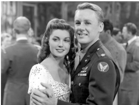
1944 FRISSON D'AMOUR (Thrill of a Romance) de Richard Thorpe avec Van Johnson