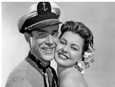
1948 DANS UNE ÎLE AVEC VOUS (On an island with you) de Richard Thorpe avec Ricardo Montalban