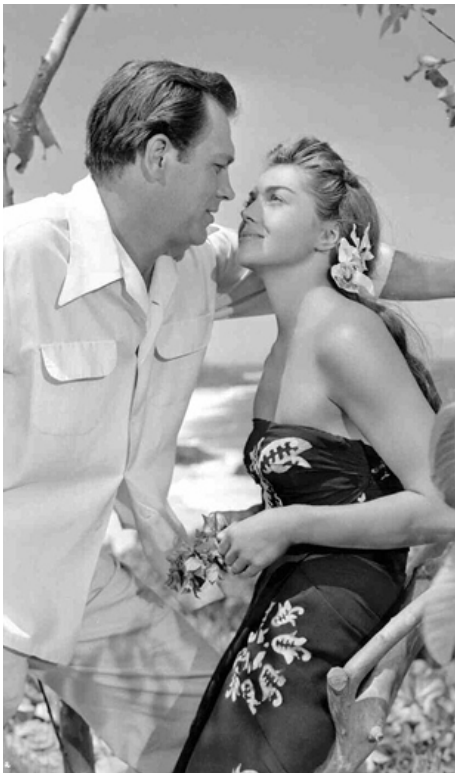
1950 CHANSON PAÏENNE (Pagan Love Song) de Robert Alton avec Howard Keel