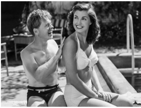
1942 LA DOUBLE VIE D'ANDY HARDY (Andy Hardy's double Life) de George B. Seitz avec Mickey Rooney