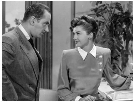
1949 LA FILLE DE NEPTUNE (Neptune's Daughter) d'Edward Buzzell avec Keenan Wynn