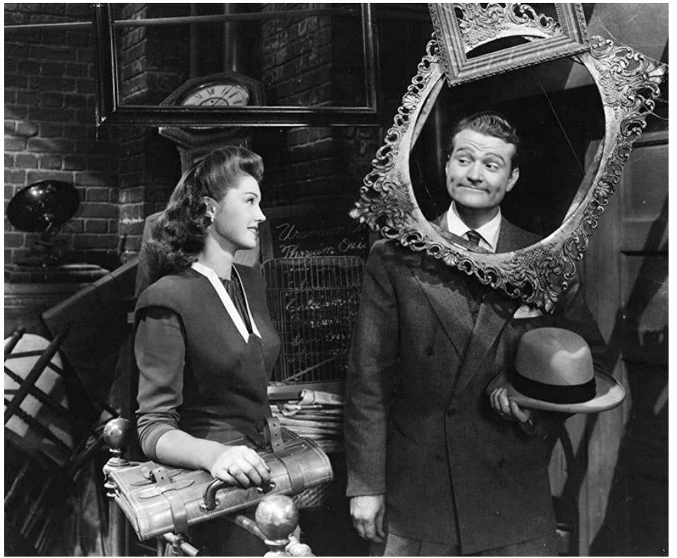
1944 LE BAL DES SIRÈNES (Bathing Beauty) de George Sidney avec Red Skelton